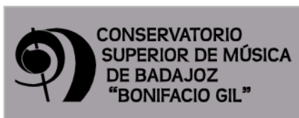
Opción logo oficial fondo blanco