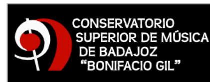
Opción logo oficial fondo negro